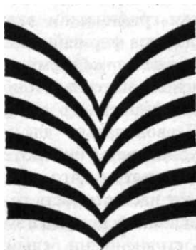
Рис. 1. Знак публичных библиотек ФРГ (1982 г.)

Обычно знаку придаются простые четкие геометрические формы; хорошо, если он "излучает" внутреннюю динамику. Так, для публичных библиотек ФРГ в качестве общего фирменного знака было предложено стилизованное изображение раскрытой книги: