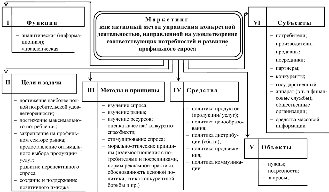
Схема 2 (продолжение)